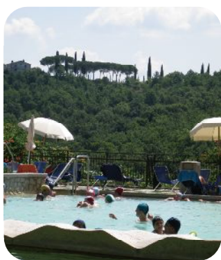
温泉プールはこの開放感がたまりません。家族で楽しんでいます。