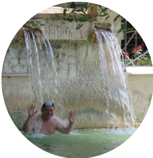
源泉のそそぎ口。結構熱い。現地の人も「打たせ湯」をしています。

その反面、庶民的なコースは、帽子・水着着用のうえ温泉プールでバシャバシャ。海や山を眺めながらのんびりプールに浸かるのは、思いのほか開放感があるものです。プールだけに、家族でいっしょに浸かれるのもいい点。