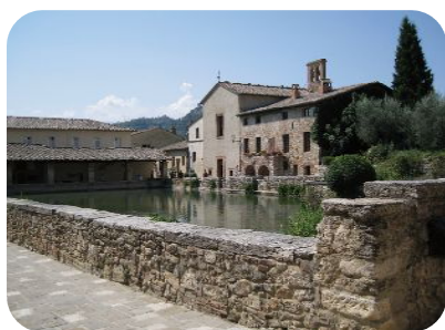
バーニョ・ヴィニョーニ、「ノスタルジア」の撮影現場。現在は温泉としては使われていません。

あなたは旅行に何を求めますか？ 私だったら、ひとつには、自然を感じながら、静かな贅沢を味わえるところ。 今では日本人観光客が押し寄せるイタリアも、日本の方々が不安がって行かないところに、イタリアらしさがきつとあります。